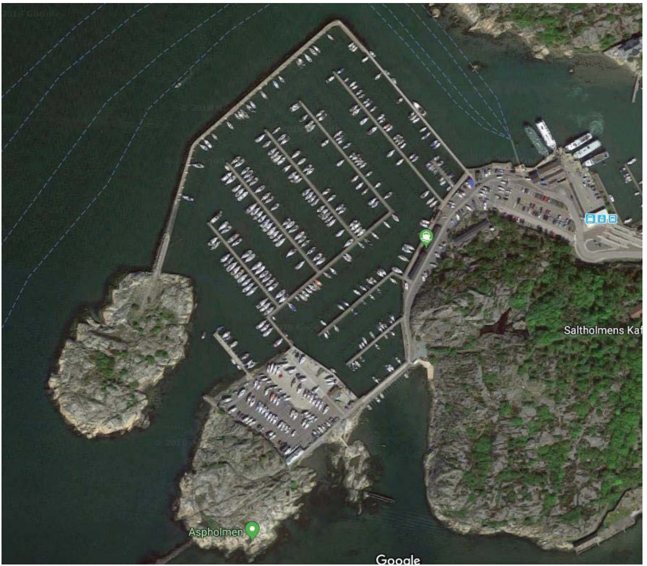
Bild 3. Hammens utformning.